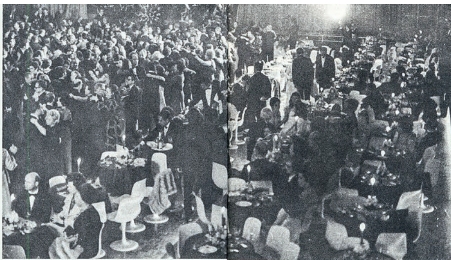
Primeira dança no novo salão

Descrever-se, seria quase impossível, mas vamos tentar. São dois andares de grandes dimensões: 120 metros de comprimento por 40 de largura. Os carros, ao entrar, passam por um enorme portico, indo para um bonito jardim e chegam ao primeiro saguão. Ali estão os porteiros. Passa-se, então, para um outro, todo envidraçado, onde estão as escadarias de madeira com lambris de jacaranda de acesso ao salão e a chapelia, tu-