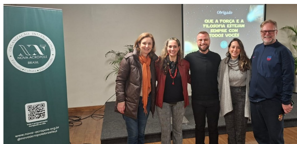
Palestrante e equipe da Pasta Cívico-Cultural ao final do evento