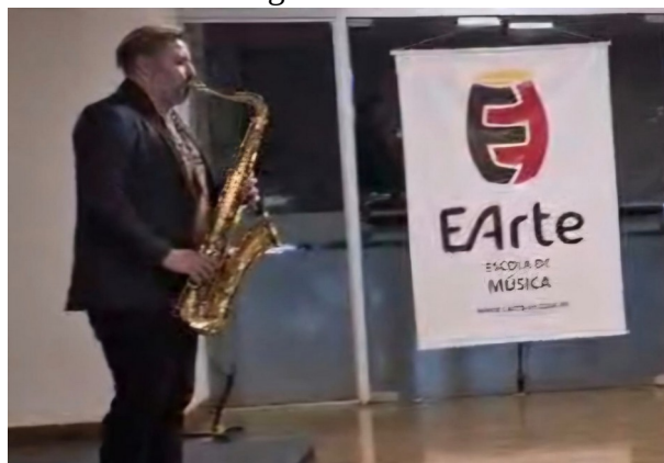
Abertura do Terceiro Encontro com participação da EArte

O tema do segundo Encontro foi “ Do Autoconhecimento à Vitória (Jornada para dentro de si) ”, e o palestrante foi o advogado, empresário e filósofo Tiago Guellar Fürst.