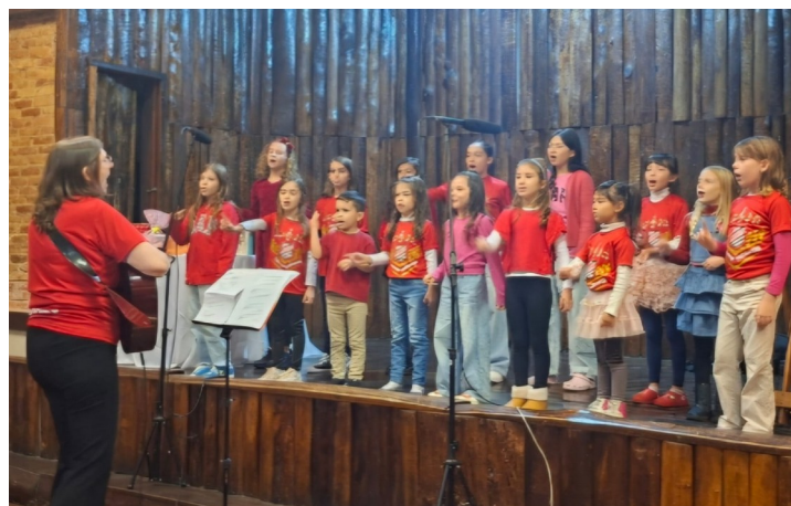
Apresentação do Coral Infantil da SOGIPA no Baile de Abertura do DCG