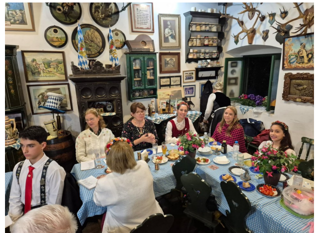
Reunião festiva mensal do Departamento de Bávaros

O convite está aberto a todos os associados: venha conhecer o Departamento de Bávaros, participar das atividades, aprender danças típicas e vivenciar de perto a rica herança cultural alemã que faz parte da história da SOGIPA.