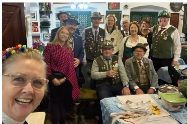
Casal Presidente da SOGIPA participando de um dos encontros da Casa Bávara