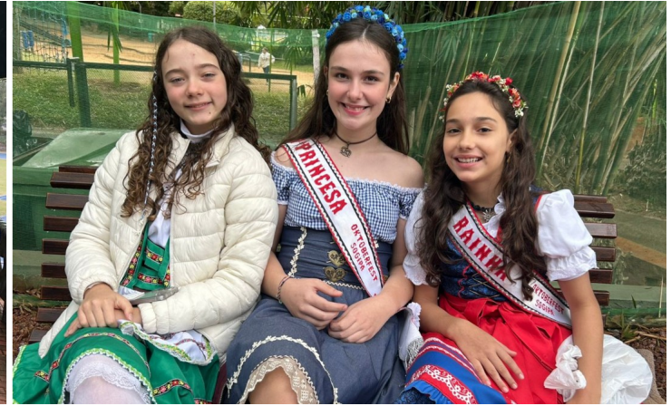
Bávaros, corte e muita gente bonita fez parte da gravação do clipe de "Sweet Caroline" da Super Banda Hopus

Muito Mais do que Completar um Álbum ♦ A inédita troca de figurinhas promovida pela Pasta Cívico-Cultural da SOGIPA, com o apoio da operadora Vivo (Telefônica Brasil), mostrou-se muito