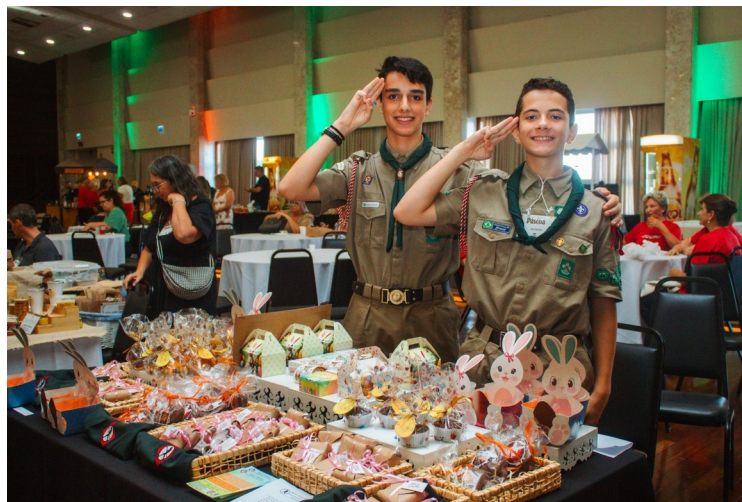
Escoteiros do Grupo Escoteiro Georg Black também marcaram presença