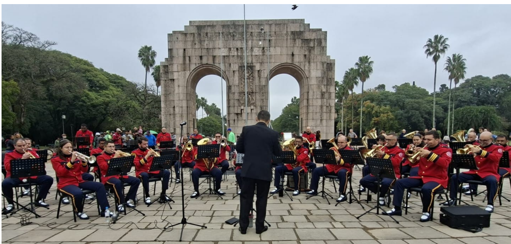
Banda Marcial São João em apresentação no Parque Farroupilha

A agenda dos próximos meses reserva momentos imperdíveis para os apreciadores da música. No dia 16 de agosto, a