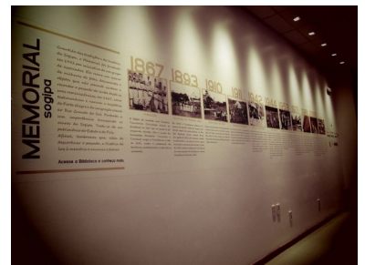
Painel elaborado pelo Memorial SOGIPA

O Memorial SOGIPA além de estabelecer parcerias com outras instituições, a fim de realizar ações significativas para o patrimônio cultural, também atende a diversas pesquisas advindas de sócios e pesquisadores externos.