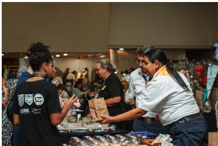
Bandeirantes participaram do Bazar de Páscoa