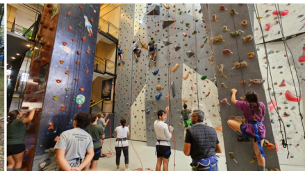
Atividades do Grupo Escoteiro Georg Black