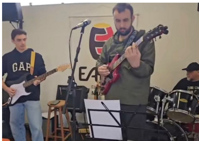
Apresentação de músicos do EArte

Marque uma aula experimental, visite-nos!