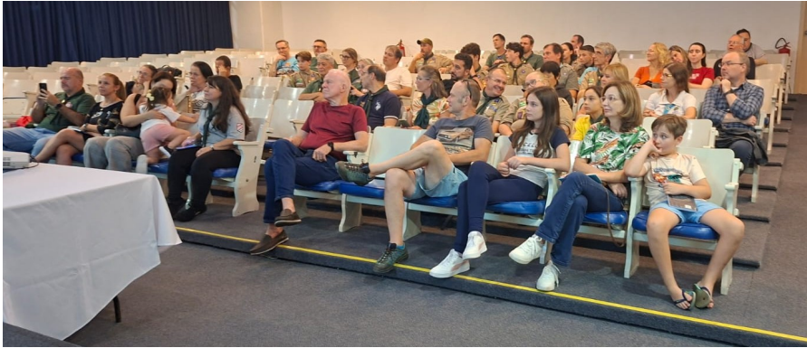
Público presente no anfiteatro para acompanhar a palestra de lançamento do livro

Foi um momento especial de valorização da história, da cultura e do espírito escoteiro, reforçando a importância de manter vivas as nossas origens e tradições. Depois do relato das aventuras épicas vividas pelos escoteiros no início do século passado, alguns dos jovens presentes ficaram tão motivados que passaram a cogitar refazer a grande caminhada.