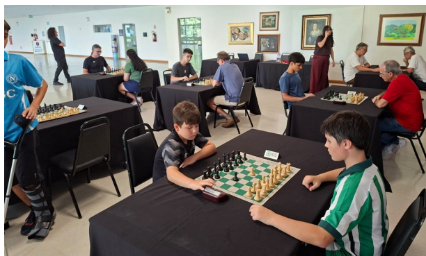
Torneio de Xadrez promovido na SOGIPA

O departamento está localizado no terceiro andar da sede social, próximo à biblioteca. Mais informações com o diretor do departamento pelo telefone (51) 98425-1440.