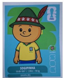
Figurinha especial disponibilizada aos participantes do evento

encontrada, desenvolvem habilidades importantes para a vida, como comunicação, cooperação, paciência, organização e respeito ao próximo. A atividade também estimula o senso de pertencimento, fortalece amizades e cria novas conexões entre associados de diferentes gerações. Em tempos cada vez mais conectados às telas, a troca de figurinhas resgata o valor dos encontros presenciais, das conversas espontâneas e dos momentos compartilhados entre pais, filhos, avós e amigos. São experiências simples, mas que deixam lembranças duradouras e ajudam a fortalecer os laços da comunidade sogipana.