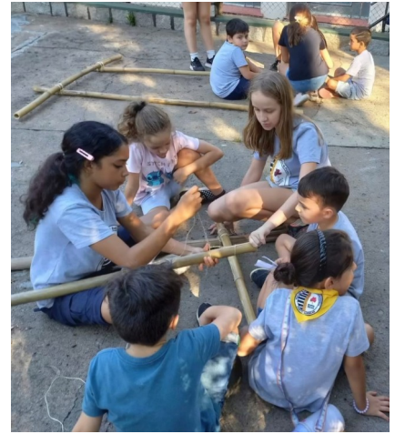
Bandeirantes realizando amarras