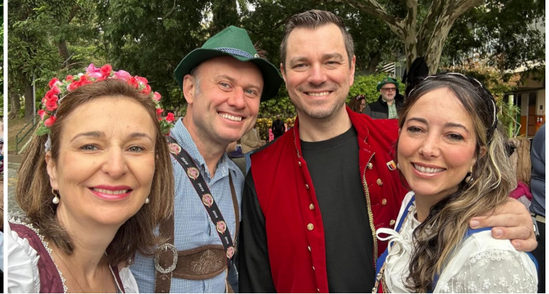
Gravação de Clipe da Super Banda Hopus: trajas típicos, chope, pratos da culinária germânica e muita alegria

A Super Banda Hopus, parceira histórica da Oktoberfest da SOGIPA, proporcionou uma manhã muito divertida e cheia de animação para associados e convidados. Ao final da atividade, todos ainda puderam degustar um delicioso cardápio alemão preparado especialmente pelo Bistrô, completando a experiência com muito sabor e tradição.