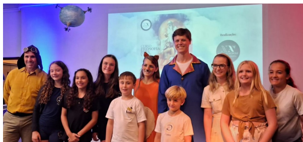
Atores, palestrante e crianças ao final do evento

O Terceiro Encontro também reuniu associados e convidados para uma noite especial de convivência, música e reflexão com o tema “ A Filosofia em Star Wars ”.