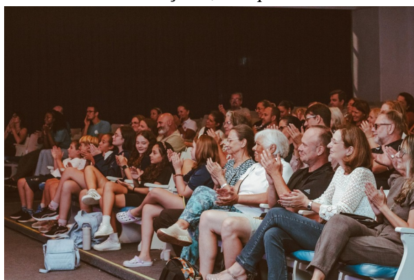
Anfiteatro lotado para prestigiar a primeira edição do Encontros