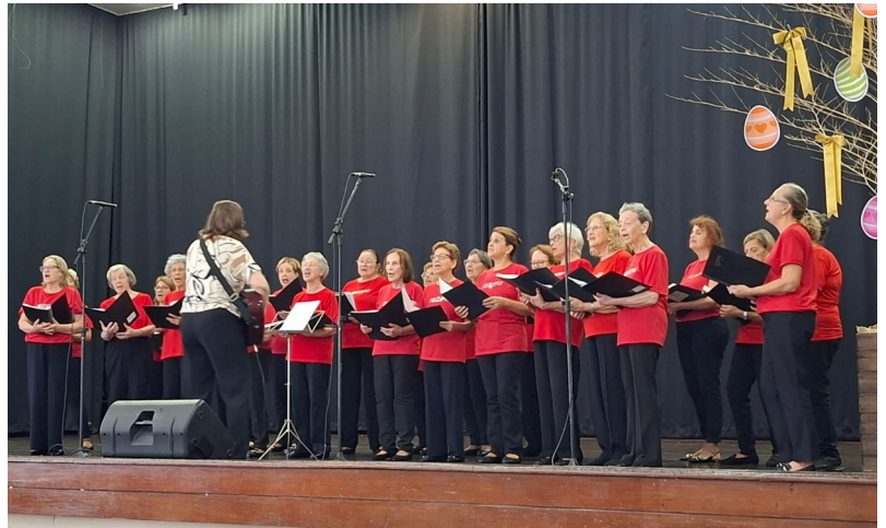
Coral de Vozes Plenas da SOGIPA em apresentação

Voltado especialmente para cantores 60+, o grupo realiza ensaios nas segundas-feiras, das 15h às 17h, no 3º andar da sede social. A atividade é gratuita para associados.