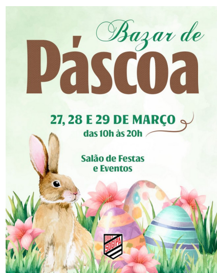
Divulgação do Bazar de Páscoa

A partir do retorno muito positivo das expositoras, que destacaram o quanto apreci-