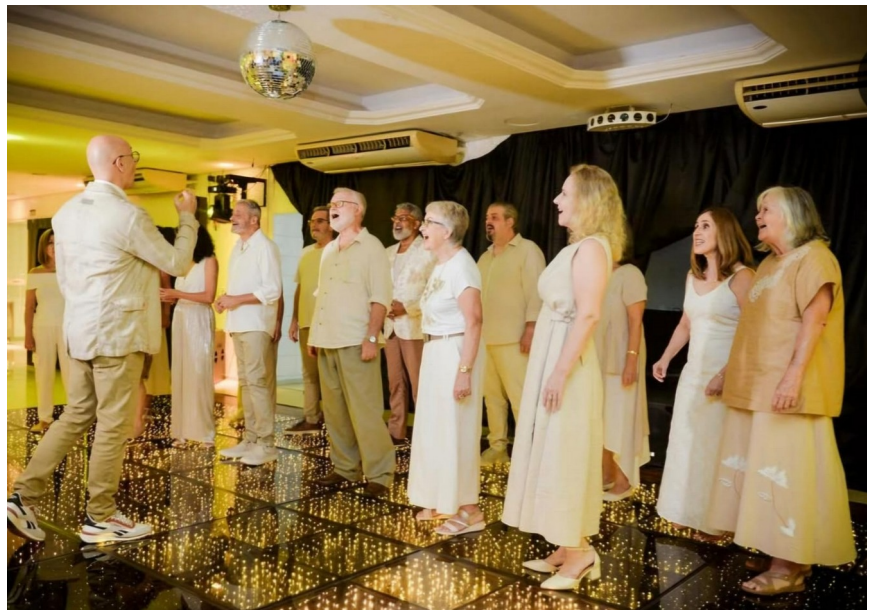
Apresentação do Coral Adulto da SOGIPA

Com dedicação, sensibilidade e espírito coletivo, o Coral Adulto segue promovendo a música coral como forma de expressão artística, convivência e celebração da cultura dentro da SOGIPA.