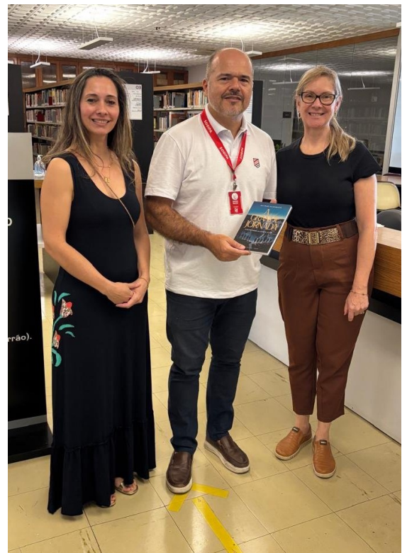
Vice-Presidente Cívico-Cultural e Presidente da SOGIPA entregando obra para a bibliotecária