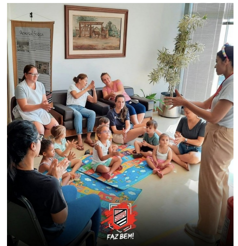
Oficina para crianças

Os associados podem aproveitar o espaço para leitura no local ou utilizar o serviço de empréstimo de livros, levando para casa novas histórias, aprendizados e experiências. As crianças têm um espaço especial na Biblioteca J. Aloys Friederichs. Por meio do Projeto Hora do Conto , realizado nas quartas-feiras, a biblioteca proporciona momentos de imaginação, aprendizado e encantamento para os pequenos sogipanos de até 8 anos.