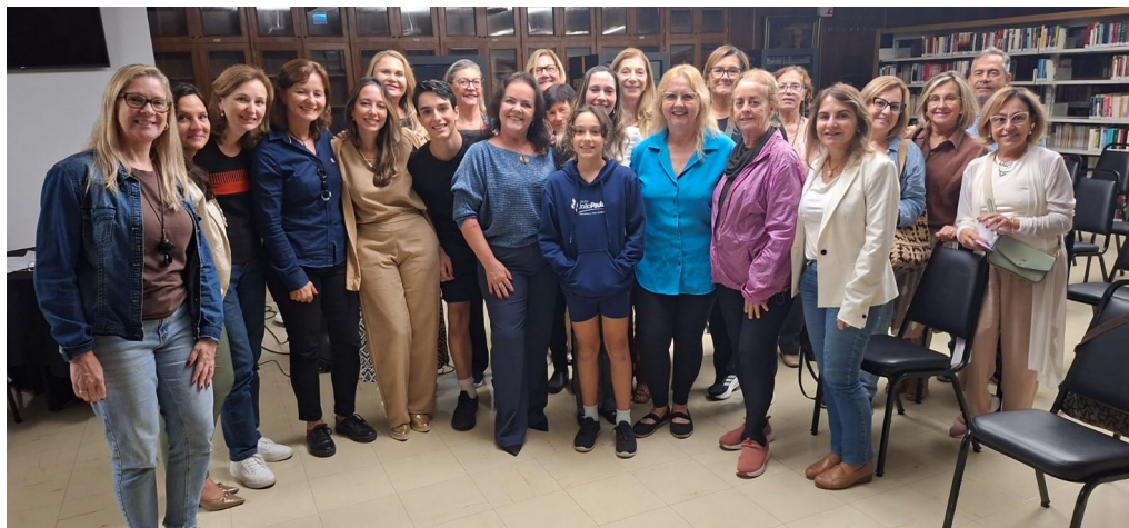
Público presente em palestra promovida pela Biblioteca