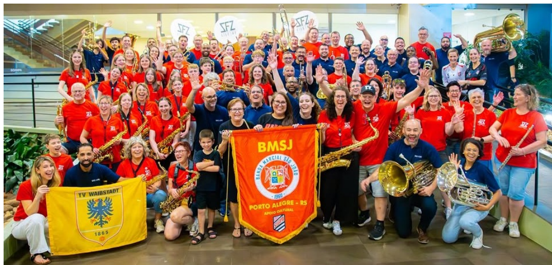
Banda Alemã SFZ Big Band Waibstadt e Banda Marcial São João no ensaio para as apresentações do Bazar de Páscoa

Assim, anunciamos com entusiasmo o futuro lançamento do "Bazar Vila Oktober SOGIPA". A proposta é valorizar o artesanato temático ligado à SOGIPA, à nossa Oktoberfest e às tradições germânicas, preparando os associados para esse grande evento. Aguardem essa novidade!