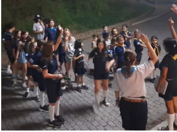
Bandeirantes em atividade

Por meio de experiências práticas, aprendizado em grupo e contato com a natureza e a comunidade, os participantes desenvolvem autonomia, criatividade e espírito colaborativo, sempre guiados pelos princípios do movimento bandeirante.