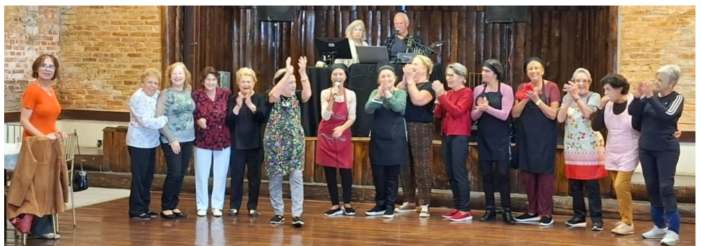
Evento promovido pelo Plenitude