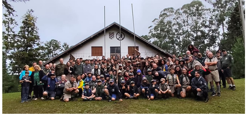
Grupo Escoteiro Georg Black na sede de São Francisco de Paula

Foi um dia de aprendizado, integração e celebração de valores que fortalecem a formação dos nossos jovens.