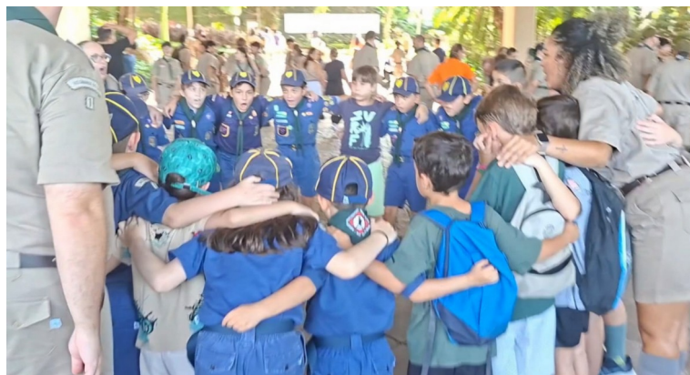
Lobinhos iniciando as suas atividades