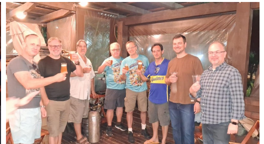
Integrantes do Bloco Cívico-Cultural & Amigos confraternizando e degustando o prêmio conquistado no Carnaval da SOGIPA