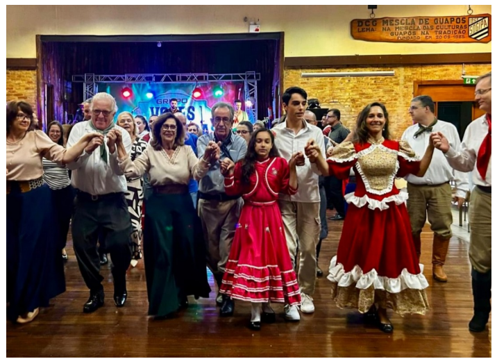
Polonaise no Baile de Abertura do DCG

E a programação continua: no dia 18 de julho acontecerá o tradicional Aleucho, prometendo mais uma noite de integração, cultura e alegria. O evento convida associados e convidados a celebrarem as tradições em um ambiente descontraído e acolhedor. Neste evento conheceremos as Embaixatrizes dos departamentos para a escolha da Rainha da Oktoberfest 2026/2027. A sugestão é que todos venham trajados com vestimentas típicas alemãs, gaúchas ou até mesmo misturando as duas culturas, tornando a noite ainda mais divertida e especial.